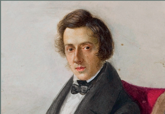
Fragment d'un Retrat de Chopin. Maria Wodzińska, 1836

La majoria de les peces que va compondre el compositor polonès Fryderyk Franciszek Chopin en la seua curta vida estaven escrites per a piano. No és d'estranyar, donada la seua personalitat una mica retreta: el piano és potser l'instrument solista que més registres permet, la qual cosa feia possible el desplegament del seu innegable talent en una perfecta soledat sonora. Chopin no es trobava a gust davant de públics nombrosos i preferia els auditoris xicotets, quasi íntims, familiars. Va ser un apàtrida que es va desenvolupar musicalment a Viena però va trobar el seu vertader refugi a París, fins al punt que va afancesar el seu nom i es va fer anomenar Frédéric François. Però això no vol dir que fora alié als avatars que va patir el seu país d'origen, dividit entre el Regne de Prússia, l'Imperi Rus o l'Àustria. La influència de la música popular polonesa és innegable en la seua obra. Condemnat a un exili permanent, pot dir-se que Chopin no va trobar mai el seu lloc en el món i que, en realitat, l'únic país que va habitar va ser el de la música. Paradigma del músic romàntic, les seues peces —sempre delicades— es caracteritzen per un timbre melancòlic i taciturn. La seua obra és la banda sonora de la tristesa.