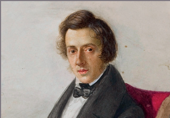
Fragmento de un Retrato de Chopin. Maria Wodzińska, 1836

La mayoría de las piezas que compuso el compositor polaco Fryderyk Franciszek Chopin en su corta vida estaban escritas para piano. No es de extrañar, dada su personalidad un tanto retraída: el piano es quizás el instrumento solista que más registros permite, lo que hacía posible el despliegue de su innegable talento en una perfecta soledad sonora. Chopin no se encontraba a gusto delante de públicos numerosos y prefería los auditorios pequeños, casi íntimos, familiares. Fue un apátrida que se desarrolló musicalmente en Viena pero encontró su verdadero refugio en París, hasta el punto de que afrancesó su nombre y se hizo llamar Frédéric François. Pero eso no quiere decir que fuera ajeno a los avatares que sufrió su país de origen, dividido entre el Reino de Prusia, el Imperio Ruso o el Austríaco. La influencia de la música popular polaca es innegable en su obra. Condenado a un exilio permanente, puede decirse que Chopin no encontró nunca su lugar en el mundo y que, en realidad, el único país que habitó fue el de la música. Paradigma del músico romántico, sus piezas —siempre delicadas— se caracterizan por un timbre melancólico y taciturno. Su obra es la banda sonora de la tristeza.