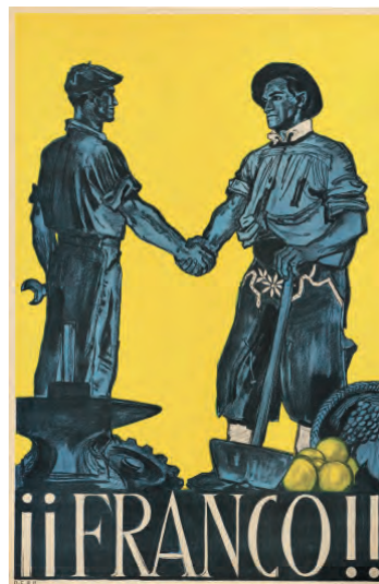
Cartell franquista amb un obrer metal·lúrgic i un llaurador donant-se la mà. 1939?