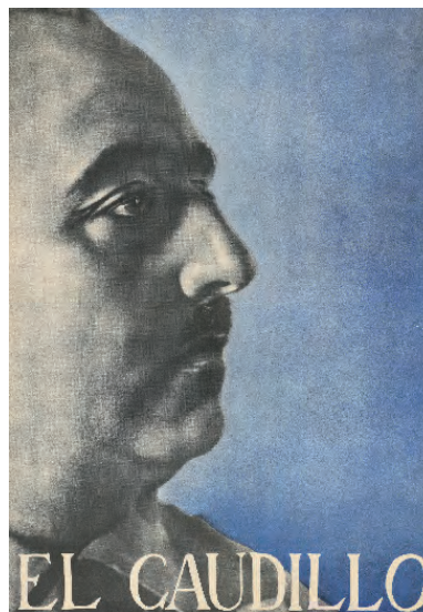
Cartell amb el perfil del dictador Francisco Franco. 1939

Les manifestacions de modernitat artística al si del règim franquista han de ser enteses, per tant, com a l'expressió d'un corrent prou minoritari, nostàlgic de l'avantguardisme i delerós d'una revolució nacionalsindicalista que, de tan pendent , no va arribar mai.