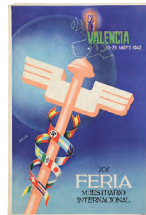
José Calandín Cartell de la XX Fira Mosttrari Internacional de València. 1942